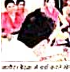
राजीव गांधी ग्रामीण-शहरी खेलकूद प्रतियोगिताओं में भाग लेने वाले खिलाड़ियों का समूह।

पंजीकृत खिलाड़ियों को बांटी टी-शर्ट। नागौर, 3 अक्टूबर: राजीव गांधी ग्रामीण-शहरी खेलकूद प्रतियोगिताएं कल से शुरू हो रही हैं। इन प्रतियोगिताओं में 15 आयु वर्गों के खिलाड़ी भाग लेंगे।