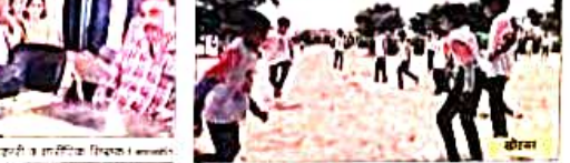
राजीव गांधी ग्रामीण-शहरी खेलकूद प्रतियोगिताओं में भाग लेने वाले खिलाड़ियों का समूह।