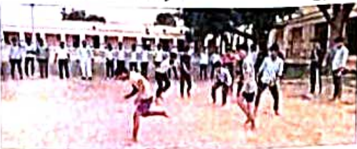
राजीव गांधी ग्रामीण-शहरी खेलकूद प्रतियोगिताओं में भाग लेने वाले खिलाड़ियों का समूह।

नागौर, 3 अक्टूबर: राजीव गांधी ग्रामीण-शहरी खेलकूद प्रतियोगिताएं कल से शुरू हो रही हैं। इन प्रतियोगिताओं में 15 आयु वर्गों के खिलाड़ी भाग लेंगे। इन प्रतियोगिताओं में 15 आयु वर्गों के खिलाड़ी भाग लेंगे।